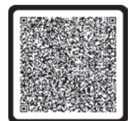
Neu in der Bücherei

Rund um die Uhr geöffnet ist unsere Online-Bibliothek 24*7 im Internet unter 247onleihe.de .