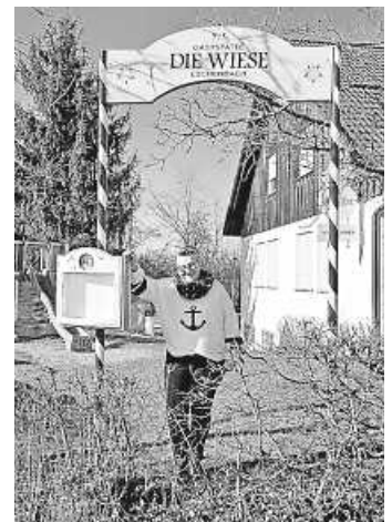
Bald hängt ein neuer Name am Schild :-)

Nähere Infos zu Konzept und genauem Eröffnungsdatum geben wir alsbald bekannt!