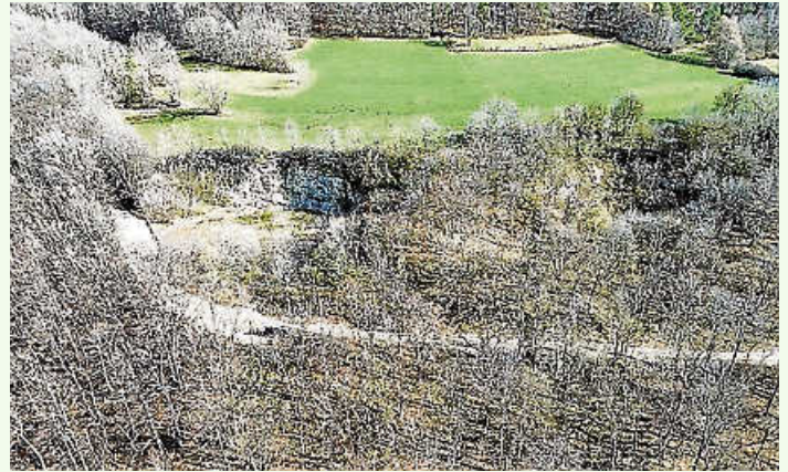
Steinbruch Schorn Februar 2025

Die Pflege des Steinbruchs wird auch in den kommenden Jahren ein gemeinsames Anliegen bleiben.