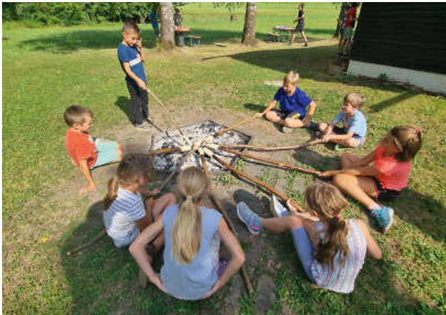
Ab durch die Wüste