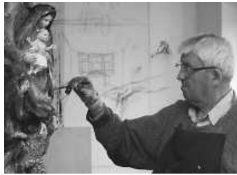
Sieger Köder 1925 – 2015

Inhalt: Wer verbirgt sich hinter diesen so farbenprächtigen und vielschichtigen Bildern, die so viele Menschen in ihren Bann ziehen, sie glücklich machen, Freude schenken und zum Nachdenken anregen?