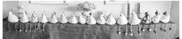
Küken aus Stoff