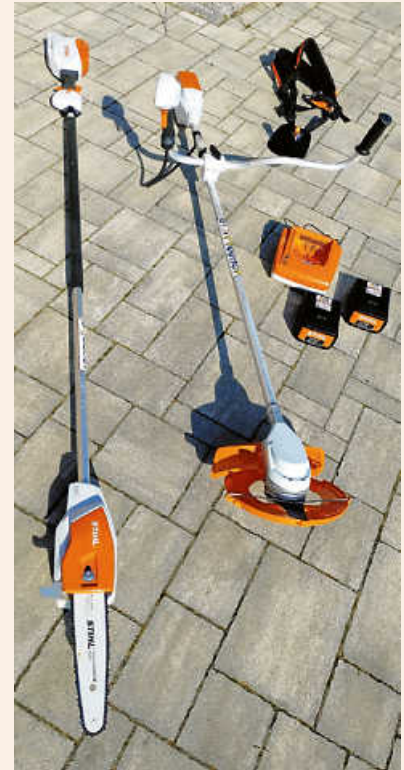
Hochentaster und Motorsense