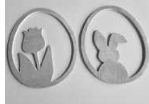
Fensterdeko aus Holz

Seit 1973 engagieren sich das ejw Geislingen und das BDJK bei der ökumenischen Ostereieraktion für Hilfsprojekte und notleidende Menschen in aller Welt. Seit 2011 beteiligt sich auch das evangelische Jugendwerk Göppingen (ejgp), welches wir als CVJM Heiningen auch in diesem Jahr bei dieser Aktion unterstützen wollen.