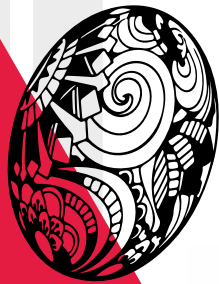
CVJM Heiningen e.V. Ev. Kirchengemeinde Heiningen